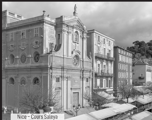
Nice - Cours Saleya