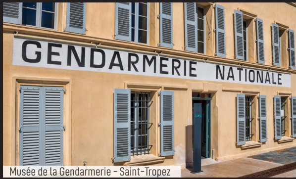
Musée de la Gendarmerie - Saint-Tropez