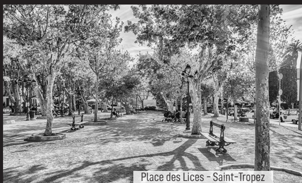
Place des Lices - Saint-Tropez