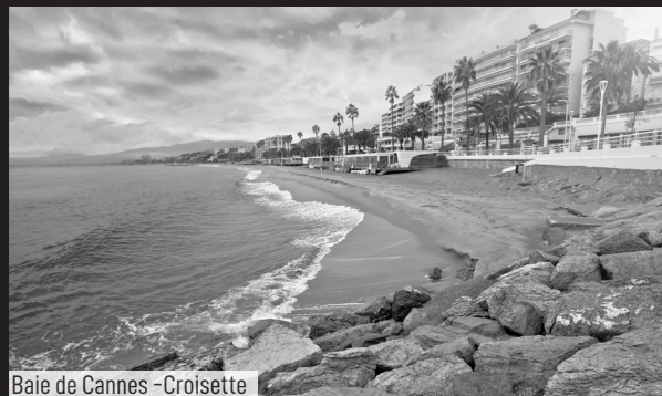
Baie de Cannes - Croisette